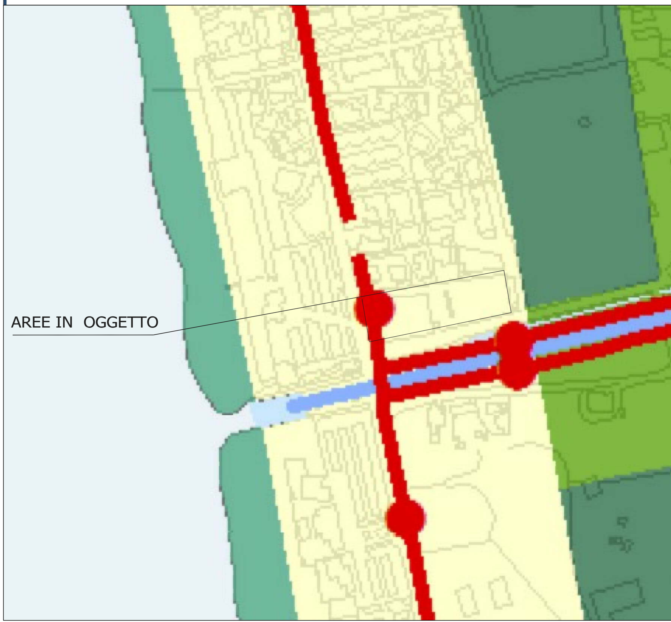
Piano Territoriale di Coordinamento dettaglio

ART. 61 AREE DI RECUPERO E RIQUALIFICAZIONE PAESAGGISTICA